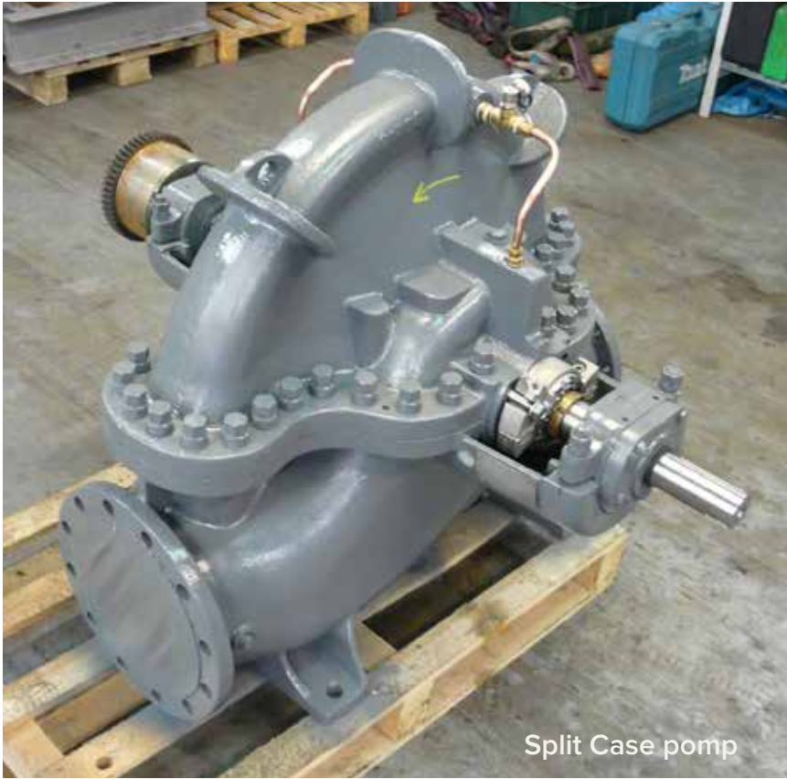
Split Case pomp