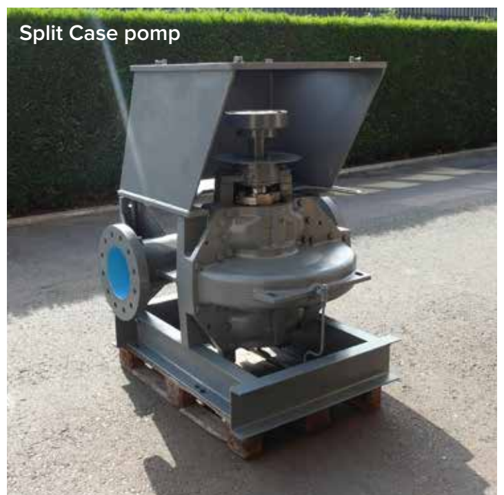
Split Case pomp