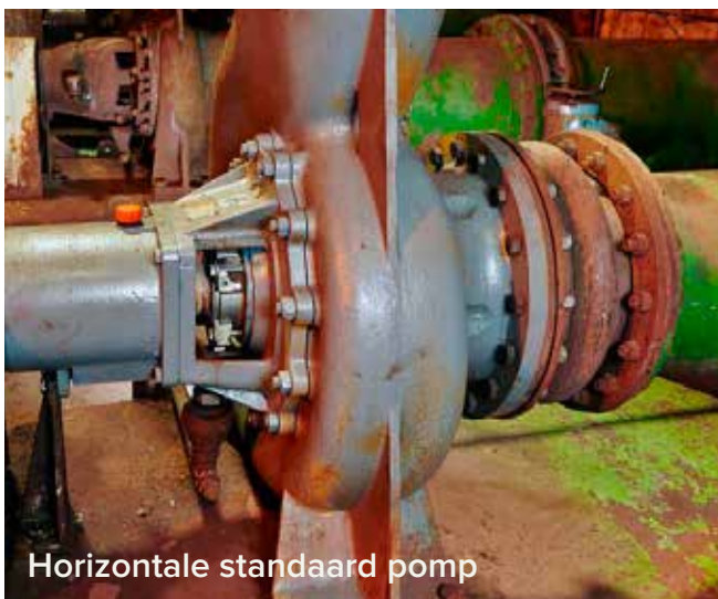
Horizontale standaard pomp

MMCo biedt een uitgebreide oplossing voor uw industriële pomp installaties. Ons personeel is opgeleid voor alle merken en alle soorten pompen.